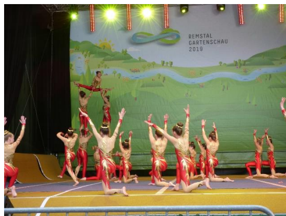
D&G-Sportakrobatik Turnen/Gymnastik vom TSV Lorch