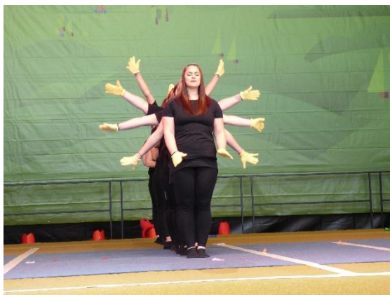
Tanzgruppe „D-licious“ vom TSV Böbingen