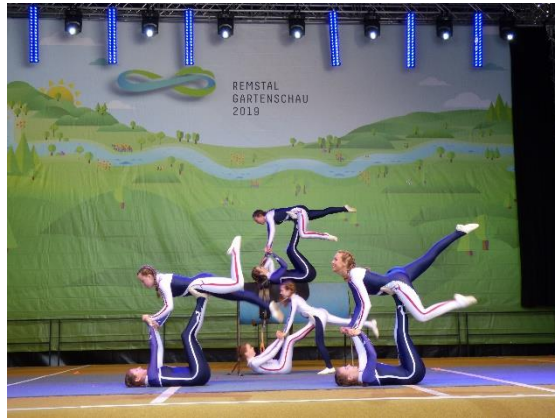
Voltigiergruppe vom SV Hegnach