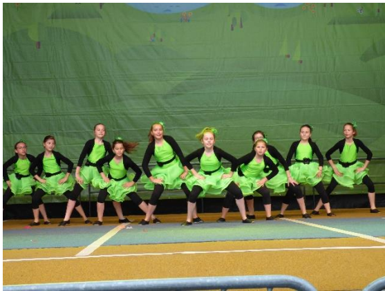
TRM/TGW-Turnen der Sportfreunde Höfen-Baach