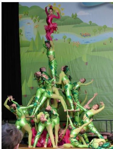
Avanti Chicks vom TSV Hüttlingen