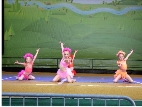
Rhythmische Sportgymnastik vom TSV Schmiden