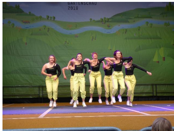
TGM/TGW-Turnen der Sportfreunde Höfen-Baach