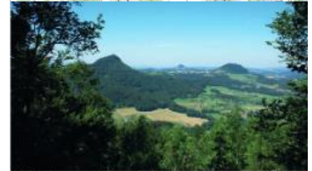
Abbildung 1: Blick auf die 3 Zeugenberge